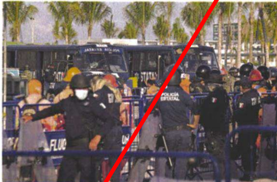
VIGILANCIA EXTREMA. Elementos antimotines y de la Secretaría de Marina resguardan los accesos a la refinería de Dos Bocas, donde el miércoles se desató un enfrentamiento.

“Y si viera usted cómo sufren, ni un baño, ni a tomar agua, aquí uno oye, y eso es lo que debería de ver la empresa, que los emplea- do con hambre y los tratan