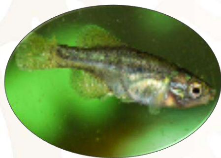
Mexclapique de la cuenca de México