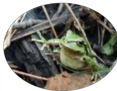
Rana de árbol plegada