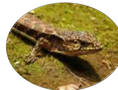
Lagarto alicante cuello rugoso