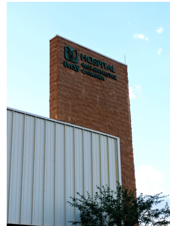
Hospital de Cananea