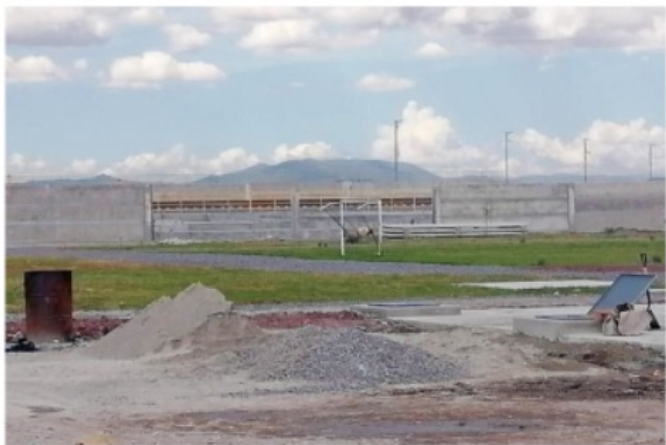
Gobierno federal se apropió ilegalmente de 91 hectáreas de terrenos para AIFA, por lo que ahora dueños legítimos piden una indemnización.