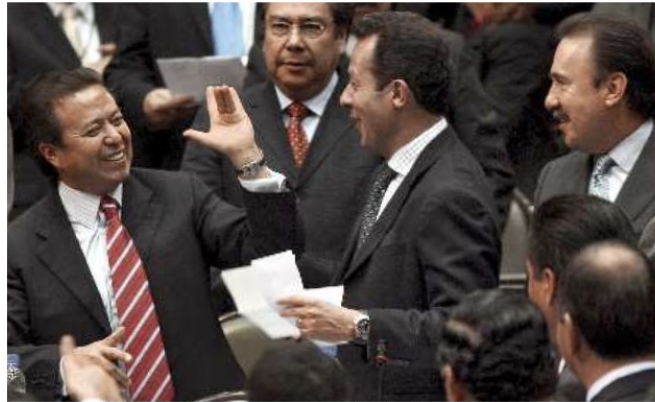
► El presidente de la Comisión de Justicia, César Camacho, impulsor de la reforma, festeja su aprobación.

Los diputados del Frente Amplio Progresista aceptaron la propuesta, con lo que retiraron votos