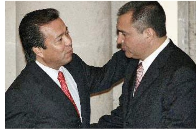
► El presidente de la Comisión de Justicia de la Cámara de Diputados, César Camacho, saluda al titular de Seguridad Pública, Genaro García Luna, durante la firma del decreto de las reformas en materia de justicia penal.