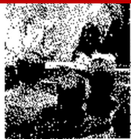
Firma Calderón el decreto de la reforma de justicia y seguridad pública.

Ante representantes del Legislativo y el Ejecutivo, Calderón declaró que la guerra al narcotráfico es una lucha de todos. El presidente dijo que la seguridad de los gobernados es el deber de todos los mexicanos.